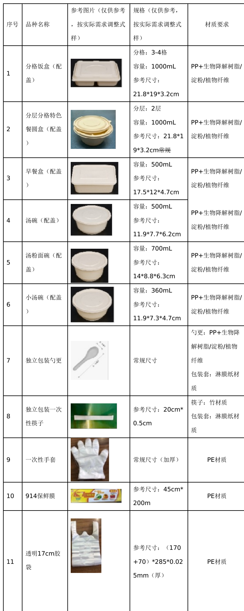
表2：广州医科大学附属妇女儿童医疗中心四院区食堂一次性餐具用品参考图片和材质要求