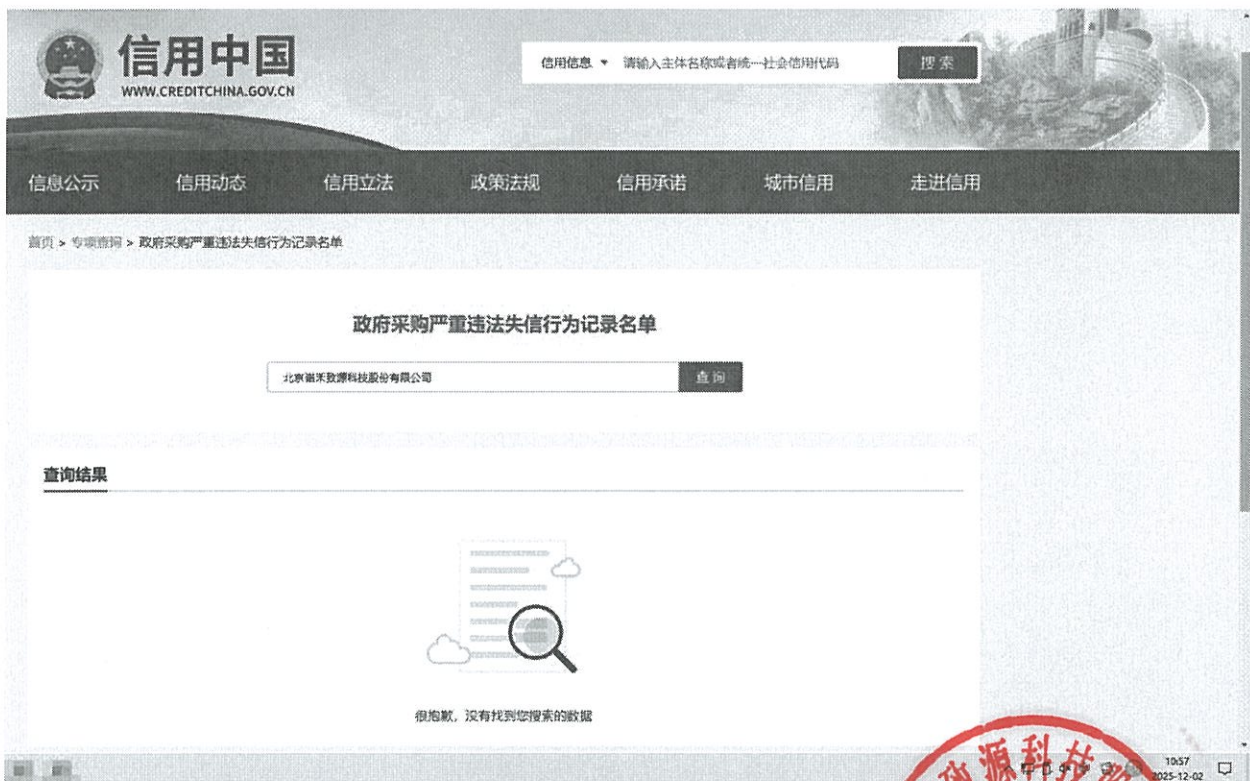
中国政府采购网查询截图